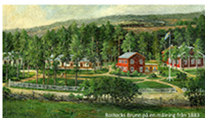
Precis där jordbruksbygden möter vildmarken på Kroppefjäll ligger Dals Rostock. Samhället klättrar upp för

Välkommen till Dals Rostock – en ort med hälsohistoria –